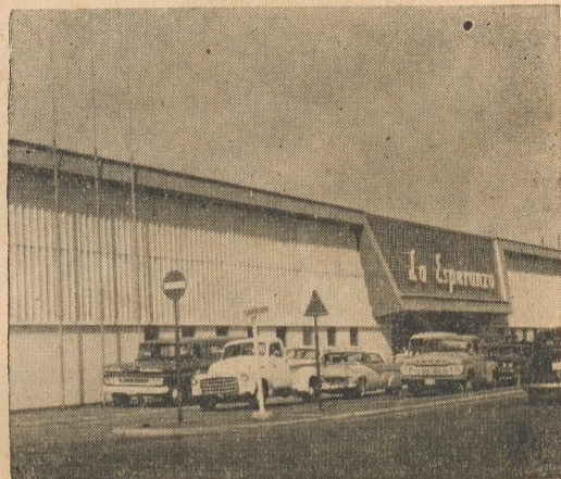
Esperanza Supermarket No. 2 Oranjestad